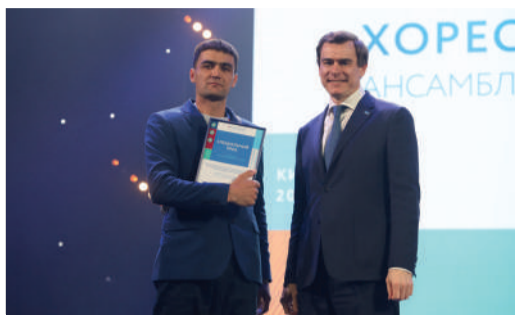
БУРЗЯНСКИЙ КОЛЛЕКТИВ В ТРОЙКЕ ПРИЗЕРОВ