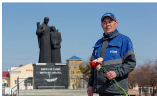
ГАЗОВИКИ ПОМНЯТ И ЧТЯТ