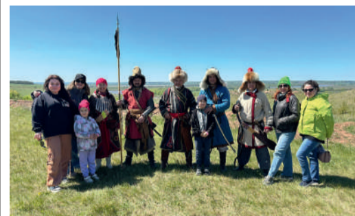
ПУТЕШЕСТВИЕ В ПРОШЛОЕ