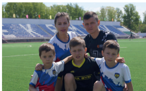
БЫТЬ МАМОЙ ТРЕХ ФУТБОЛИСТОВ