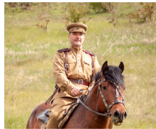
Рафаэль БИГАЕВ

Фестиваль «Река времени» в этом году посетило около 4000 зрителей, в числе которых были и около 150 членов профсоюза из филиалов в г. Уфа, д. Князево, Газкомплект.