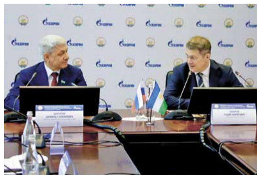
КУРС НА ИМПОРТООПЕРЕЖЕНИЕ стр. 4