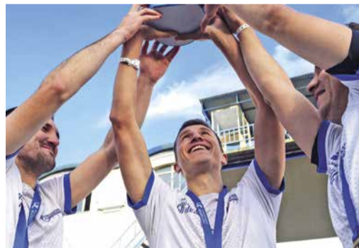
ЧЕМПИОНЫ БАШКОРТОСТАНА стр. 6