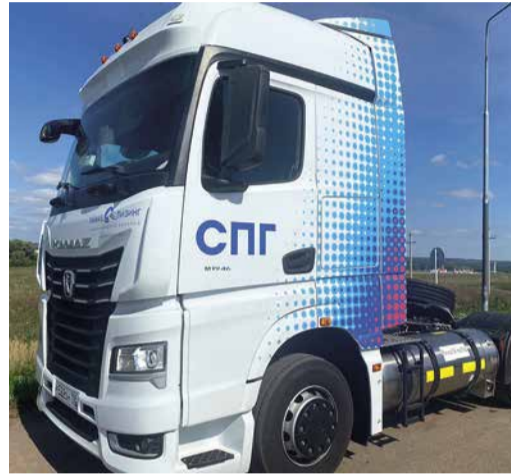
Седельный тягач на СПГ