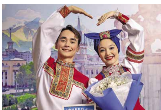
ВПЕРВЫЕ В СОЛНЕЧНОМ БИШКЕКЕ стр. 5