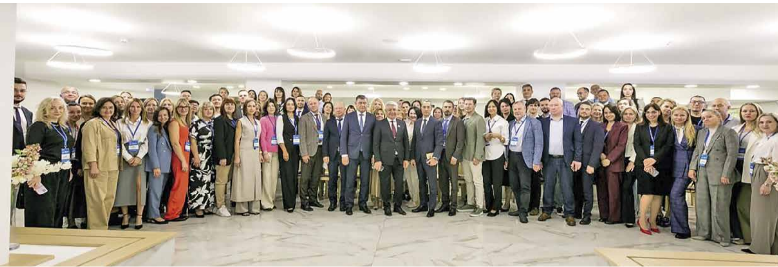
Уфу посетили свыше ста участников семинара-совещания

Свыше ста представителей дочерних обществ компании рассмотрели вопросы цифровой трансформации корпоративных коммуникаций, современные тренды и возможности цифровой платформы «ГИД», созданной для полумиллионной команды компании.