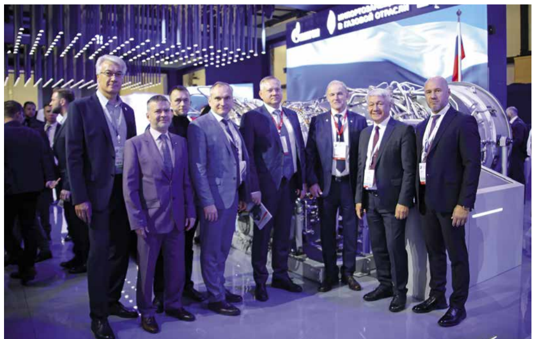
В партнерстве – к общим целям

Двигатель нового поколения АЛ-41СТ-25 разработан ОКБ им. А. Люльки и создан в рамках соглашения между ПАО «Газпром», Госкорпорацией «Ростех» и Правительством Республики Башкортостан.