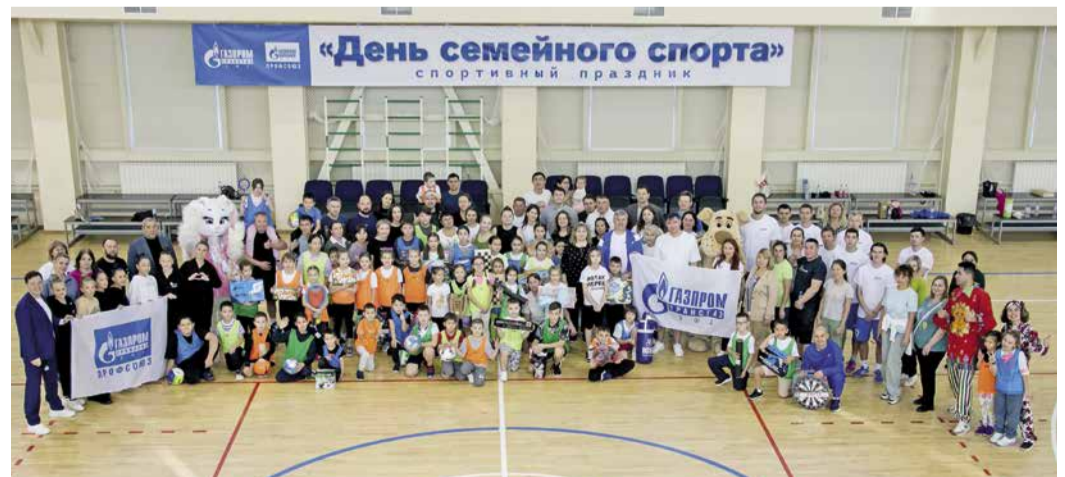
В мероприятии приняли участие работники уфимских филиалов, администрации и их дети