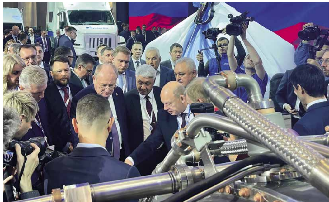
Обход экспозиции официальными делегациями