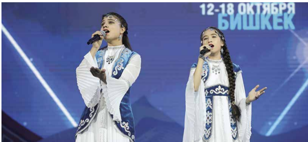
Вокальный дуэт «Райхан»