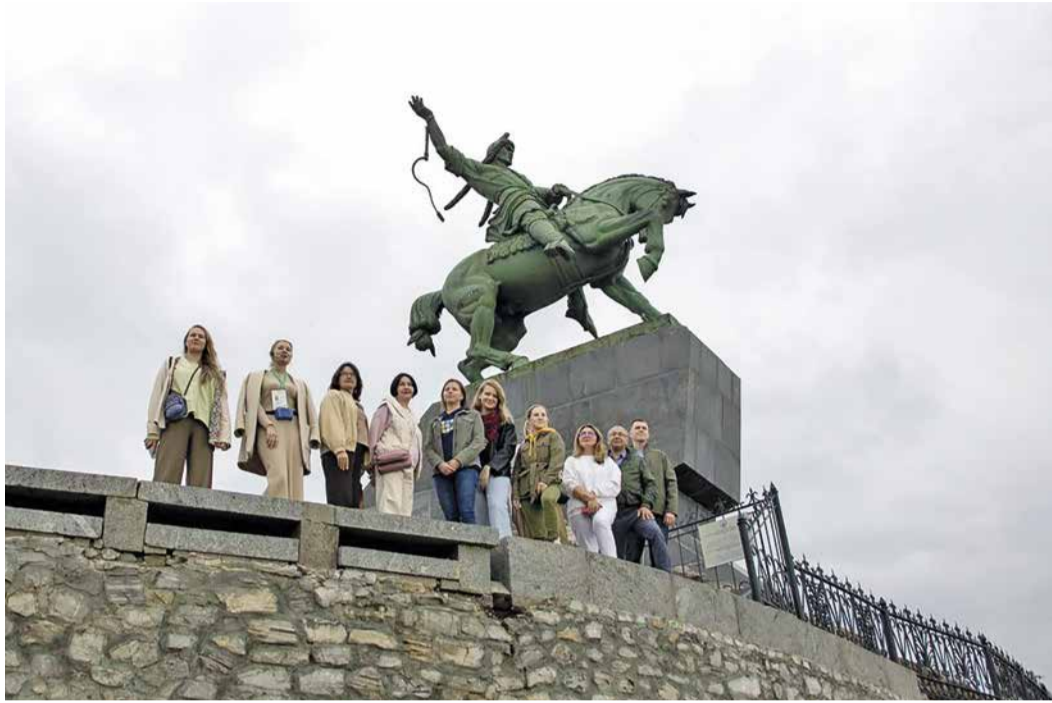
Фотография на память у главной достопримечательности города

В Уфе состоялся семинар-совещание руководителей PR-подразделений компаний Группы Газпром.