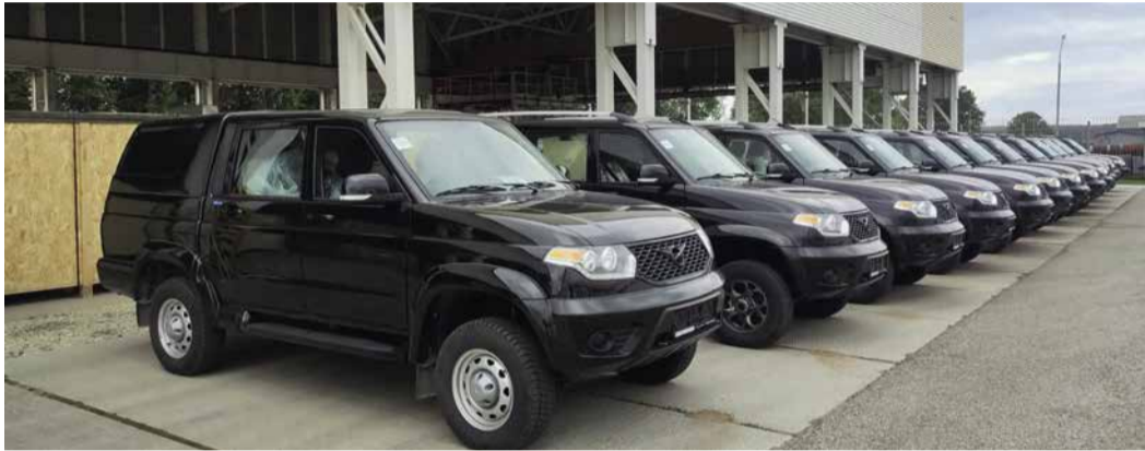
К работе готовы