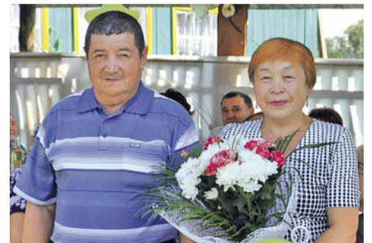
50 СЧАСТЛИВЫХ ЛЕТ стр. 8