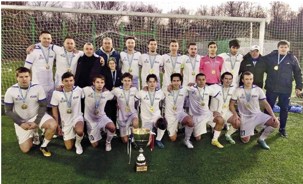
Футболисты ООО «Газпром трансгаз Уфа» – лучшие в республике!

Выражаю благодарность руководству Общества, тренерскому составу, болельщикам и всем, кто нас поддерживал!