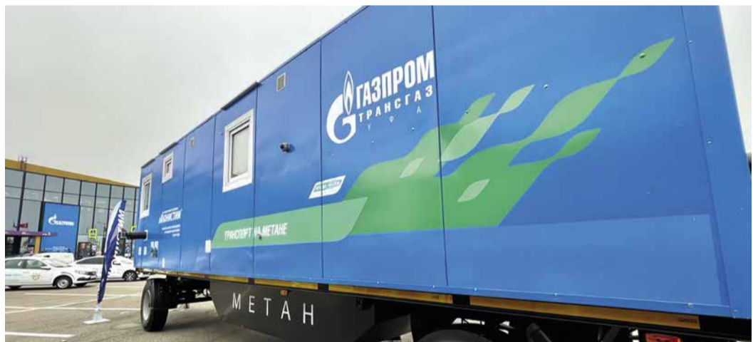
Вагон-дом завода паровых установок «Юнистим» разработан при участии башкирских газотранспортников

Жилой фургон комфортен для проживания за счет использования оборудования, работающего на метане, для отопления, освещения, приготовления и хранения пищи, работы генератора, бытовых приборов. Его эксплуатация может осуществляться в двух режимах – обо-