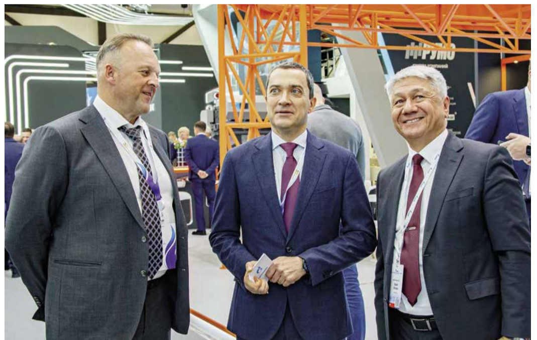
На полях форума

серьезный игрок. Имя этому игроку: спекулятивный капитал. Появились новые правила игры. Появились новые торговые алгоритмы.