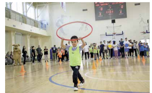
Вперед к победе!