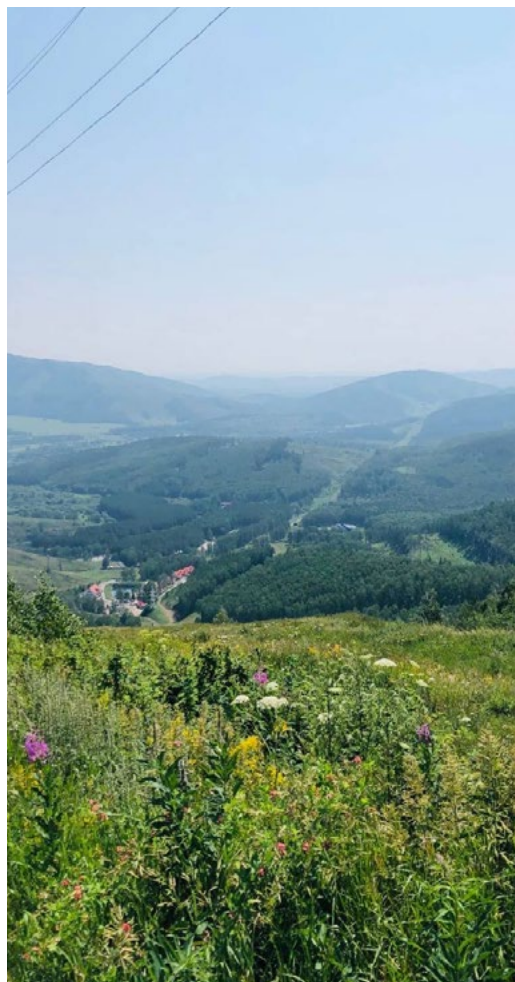
Многоцветный мир родного края

Знакомим вас с новыми работами сотрудников ООО «Газпром трансгаз Уфа» из разных уголков нашей республики.