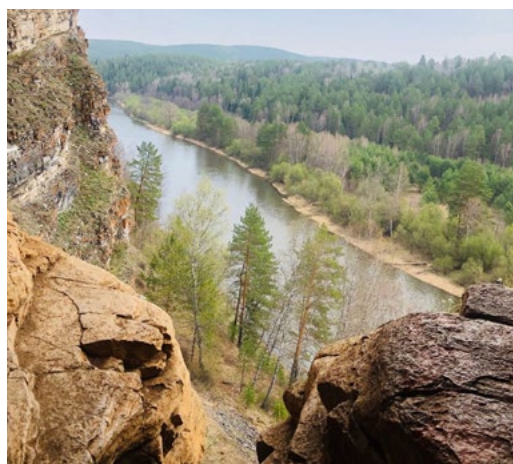
Рассвет на Айгирских скалах