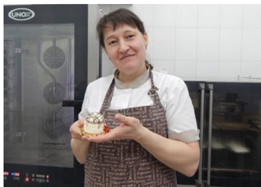
Искусство, которое можно попробовать на вкус

Акцию «Рецепты счастливой семьи» продолжает работник ООО «Газпром трансгаз Уфа».