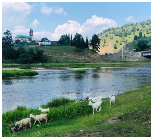
Тонкие контрасты лета