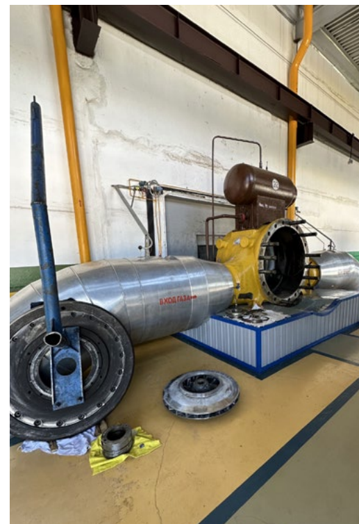
Оборудование в процессе ремонта

– При планировании работ, организации, мониторинге и формировании отчетности мы используем все современные цифровые ресурсы, которые вводятся и применяются в ПАО «Газпром». Основными программными комплексами является АСУ ТООиР (автоматизированная система управления техническим обслуживанием и ремонтом оборудования, которая интегрирована с ИУС Общества и ПАО «Газпром») и предоставляет широкий функционал, охватывающий всю цепочку бизнес-процессов ДТОиР), АРМ-контроль качества ремонтных работ, АРМ-контроль диагностических обследований. В части применения новых технологий на этапе проектирования СПКР ООО «Газпром трансгаз Уфа» использует актуальные реестры МТР и оборудования, которые допущены к применению на объектах ПАО «Газпром». Кроме того, для повышения эффективности при разработке сметной