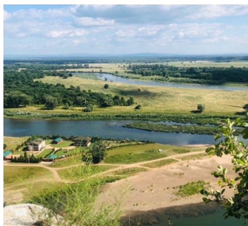
Навстречу солнечному свету