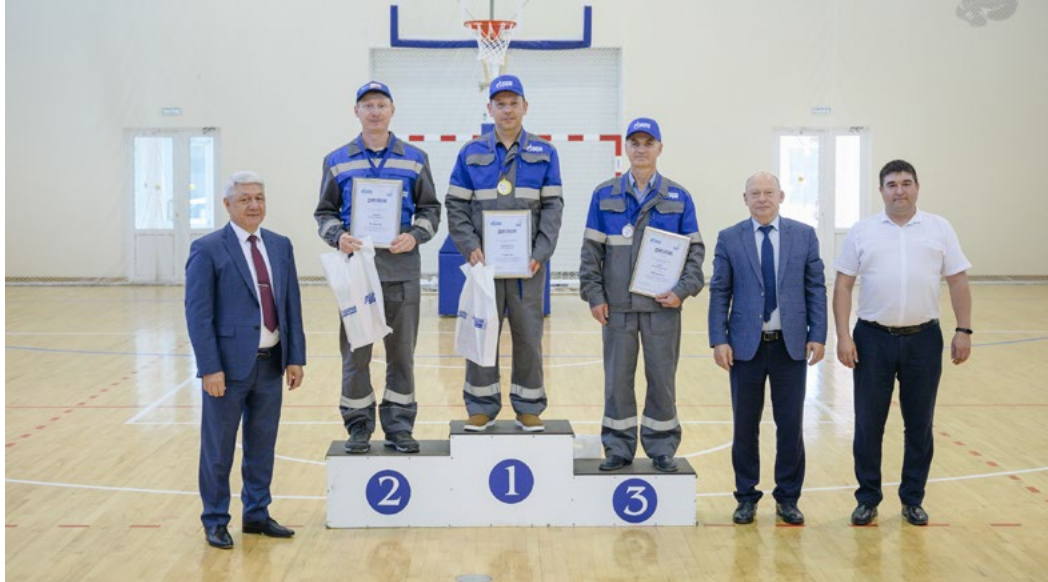
Победители и призеры конкурса профессионального мастерства – 2024

«Конкурс предусматривает выполнение теоретического и практического задания двумя участниками в составе бригады-рез-