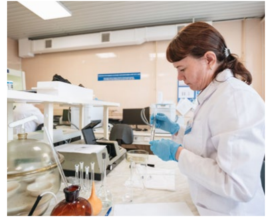
В лаборатории все под контролем

Победителям в номинациях «Лучший оператор ГРС», «Лучший лаборант химического