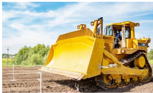
За рулем бульдозера