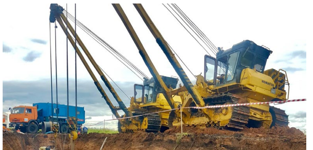
В процессе устранения дефектов