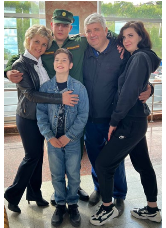
Провожаем сына в армию

любовь к спорту и своим детям, обучая их верховой езде. Младший сын, как и мама, обладает творческими способностями и занимается музыкой.