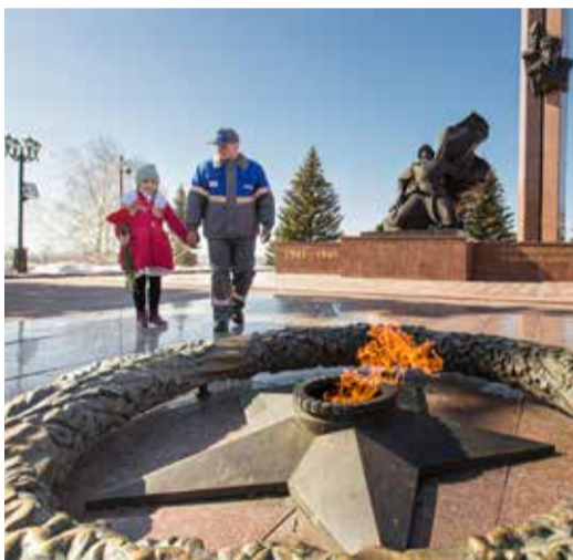
В уфимском Парке Победы

В рамках всероссийской акции «Храним огонь Победы» в селе Федоровка Республики Башкортостан зажжен новый Вечный огонь у мемориала «Памятник неизвестному солдату».