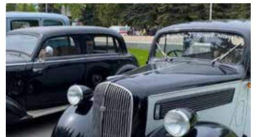
В праздничные дни планируется показ ретроа техники

Здесь поэтапно показаны основные вехи Великой Отечественной войны, судьбы наших земляков-героев, жизнь и труд в тыловом Башкортостане. Впервые в музее экспонирует-