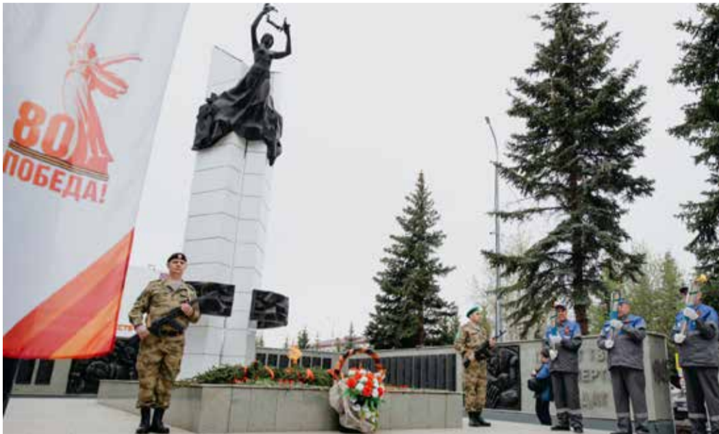
В Янауле зажжен Вечный огонь

Вечный огонь – символ памяти, благодарности и скорби народа. Негасимое пламя воплощает неисчерпаемую силу национального духа, стойкость и готовность отдать жизнь за свободу.