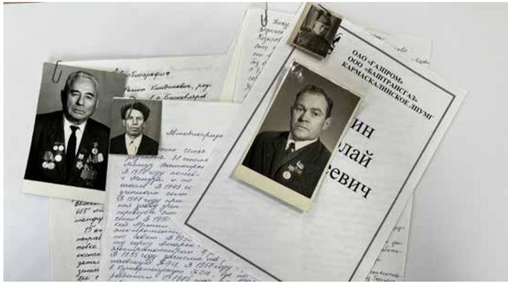
Достоинные предприятия – страницы памяти, исписанные ровным, аккуратным почерком ветеранов Великой Отечественной войны

В архиве Службы по связям с общественностью и СМИ Общества сохранились уникальные рукописи – автобиографии ветеранов Великой Отечественной войны, из которых сложились удивительные истории о судьбах поколения победителей.