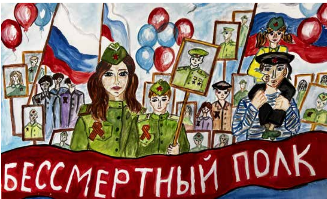
Рисунок семьи Ямщиковых, Стерлитамакский ЛТУ УС

Путь длиной в 3 года, 10 месяцев и 18 дней посетителям поможет пройти дневник, чьи страницы с удивительной наблюдательностью и совершенной честностью подведут к бесценным артефактам времен Великой Отечественной войны и уникальным историям людей, приближавших Победу.