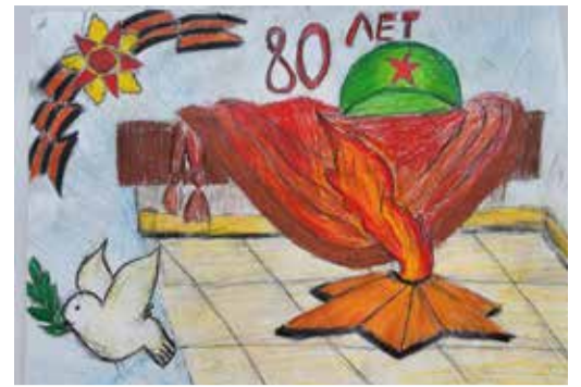
Рисунок семьи Назаровых, Дюртюлинское ЛПУМГ

По-настоящему вечным в СССР стал огонь, вспыхнувший 6 ноября 1957 года на Марсовом поле в Ленинграде. От его пламени были