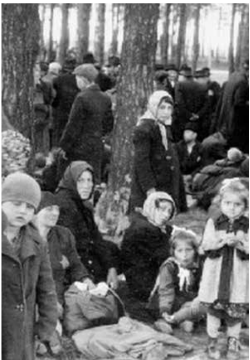
218 евреев из Долгиновского гетто были выведены за линию фронта