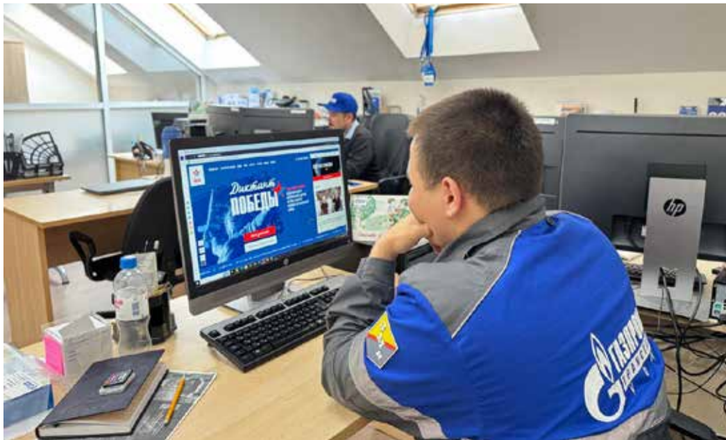
Работники Общества – постоянные участники акции

В Башкортостане акция охватила 609 площадок. В год 80-летия Победы диктант вновь стал отличной возможностью для всех желающих проверить свои знания и выразить уважение к истории. Его основная цель – про-