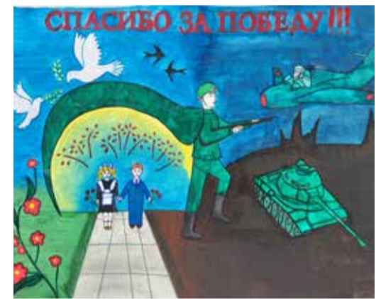
Рисунок семьи Хазиевых, Шаранский ЛПУ УС

Рад, что молодежь не забывает. Строить дом помогало все ЛПУ. Сено, дрова привезти – даже просить не надо, сами узнают, привезут, разгрузят. На все праздники приглашают, подарки дарят, словом, не оставляют без внимания. Вот и на 23 февраля наручные часы подарили. А на 50-летие Великой Победы «Баштрансгаз» машину выделил, «Оку»!