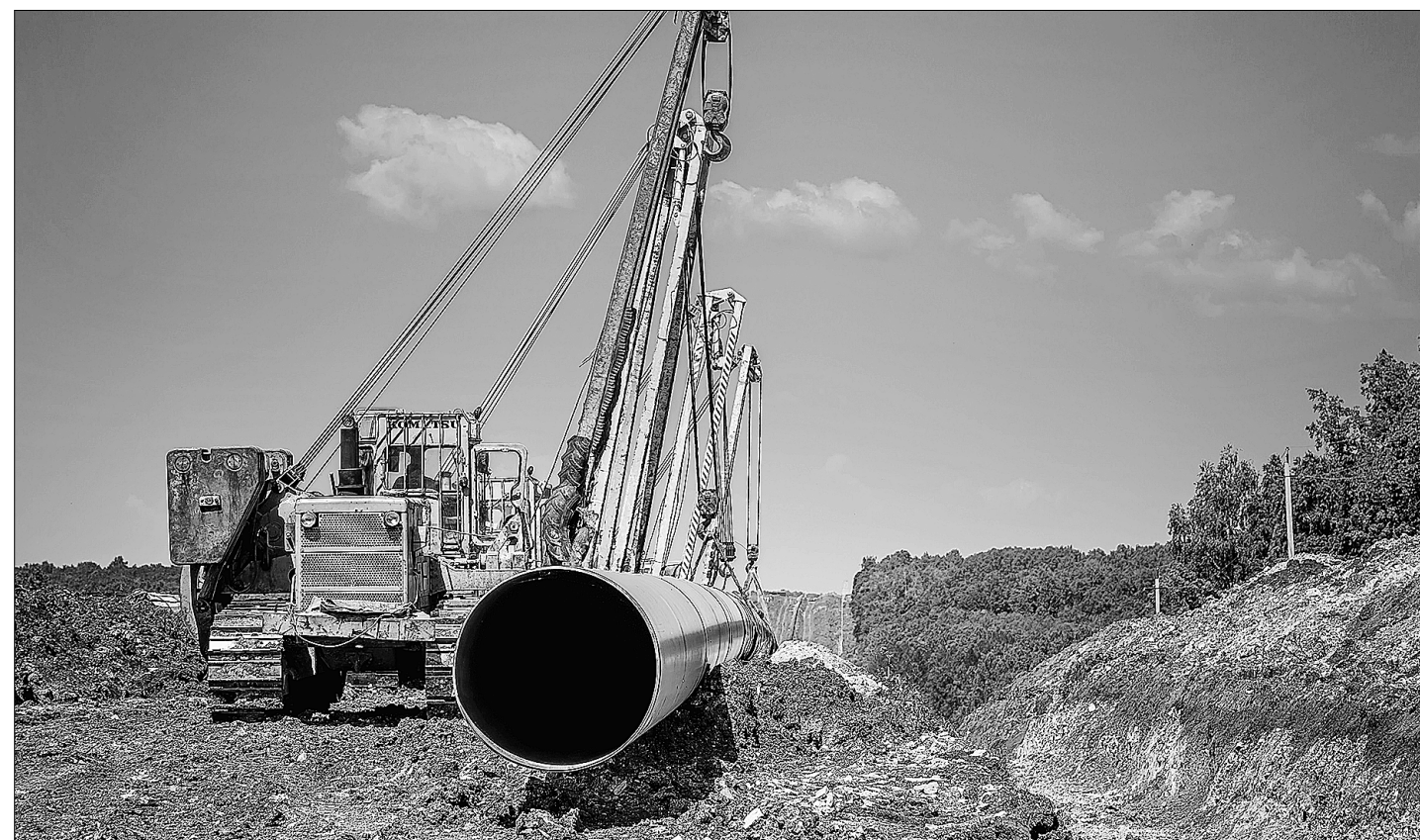
В 2018 году ООО «Газпром трансгаз Уфа» показало качественную и эффективную работу.

К годовому Общему собранию акционеров ПАО «Газпром» газотранспортное предприятие республики подходит с хорошими результатами