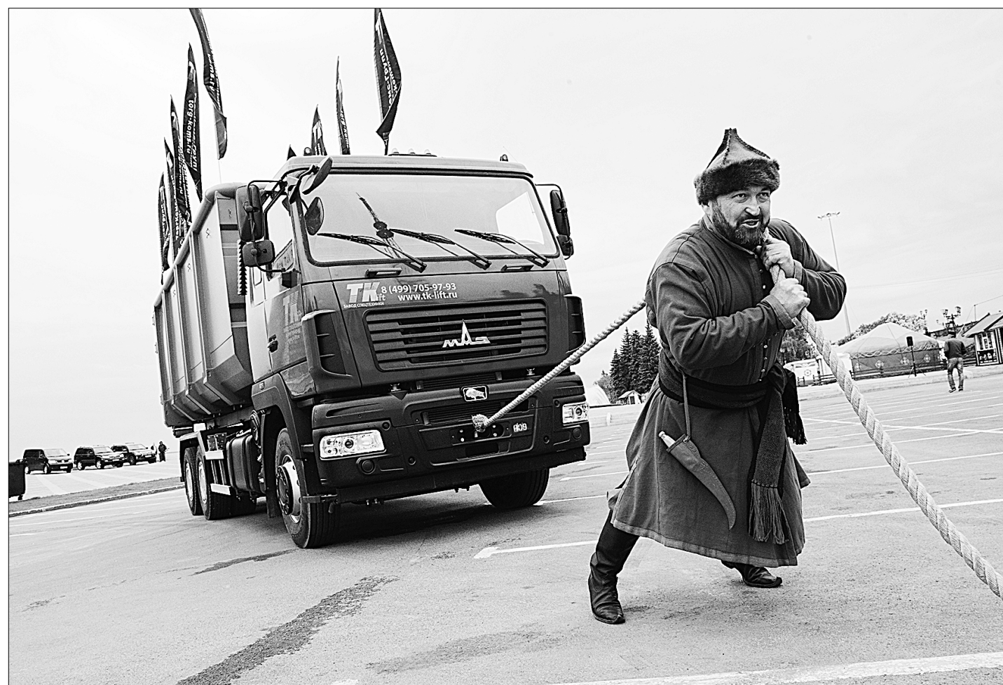
Сдвинуть с места машину реформы ТКО ох как непросто...

В Уфе участники международного съезда регоператоров поделились опытом переработки отходов