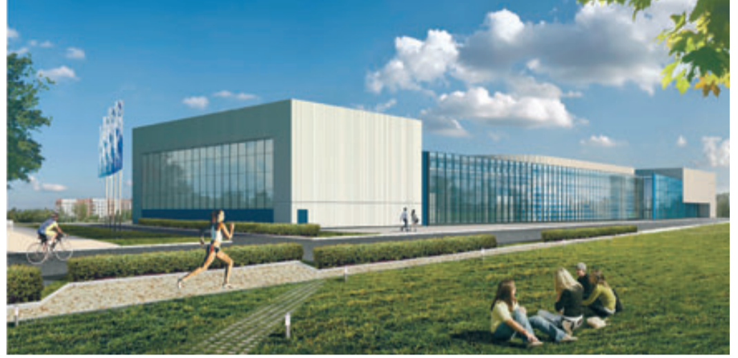
Проект будущего физкультурно-оздоровительного комплекса

Ранее в 2013 году в Уфе прошли зимние Международные детские игры. В рамках праздника состоялось открытие нового здания детско-юношеской спортивной школы олимпийского резерва по горнолыжному спорту на территории уфимского спорткомплекса «Олимпик-парк», построенного при поддержке ПАО «Газпром». В этот раз социально ответственная компания планирует возвести по программе «Газпром – детям» физкультурно-оздоровительный комплекс с бассейном, катком и многофункциональным игровым залом в Уфе.