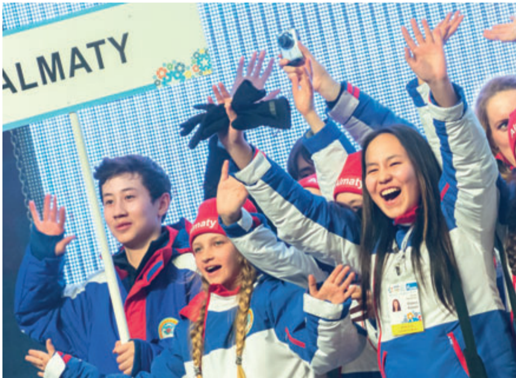
Открытие зимних Международных детских игр, 2013 г.

Давно доказано, что стабильность и достижение высоких производственно-экономических результатов невозможны без формирования и активной поддержки социальной инфраструктуры, без заботы и внимания к работнику. Своей эффективной деятельностью это подтверждает ООО «Газпром трансгаз Уфа» – одно из тех предприятий, которые и в сложное кризисное время не отказались от решения социальных вопросов. Обеспечивая бесперебойную и надежную транспортировку газа, оно не перестает заботиться и о благополучии жителей Башкортостана.