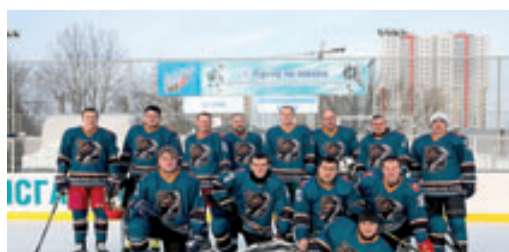
ИТОГИ X ТУРНИРА КОРПОРАТИВНОЙ ХОККЕЙНОЙ ЛИГИ стр. 4-5