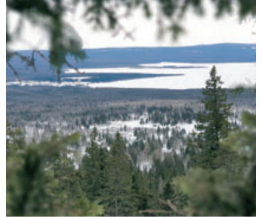
Вид с вершины хребта

– С плато нам открылся красивый вид на озеро, хребет Нургуш и Голую сопку, конусообразную вершину практически идеальной формы, что лежит на самом юге хребта