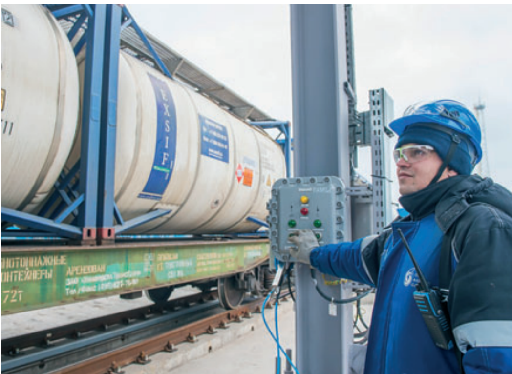
Отправка бутилакрилата потребителям

– Необходимо переводить на более чистые, экологические решения предприятия ЖКХ, энергетики, транспорта. В том числе