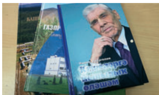
ВСЕ ТЕПЛО ДУШИ – В ОДНОЙ КНИГЕ стр. 3

набрала баскетбольная команда Общества на играх зимней Спартакиады ПАО «Газпром»