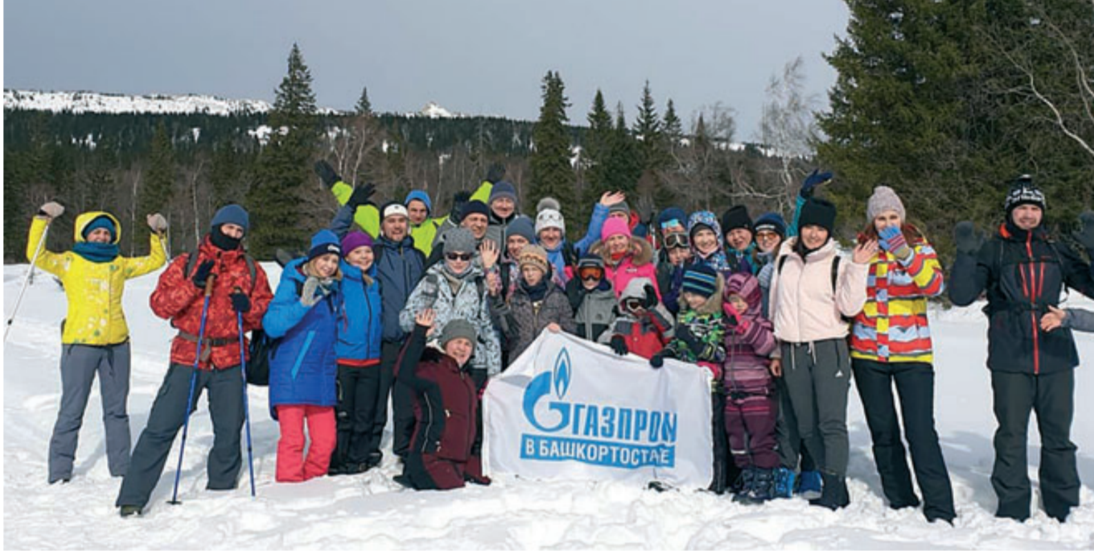
Восхождение на хребет Зюраткуль надолго останется в памяти участников экотура

С 8 по 10 марта работники и члены их семей корпоративного альянса «Газпром» в Башкортостане» приняли участие в экотуре по Южному Уралу. Мероприятие прошло в рамках проекта по преодолению своих возможностей «Вместе к вершинам». Организаторами восхождения выступили профсоюзные организации предприятий.