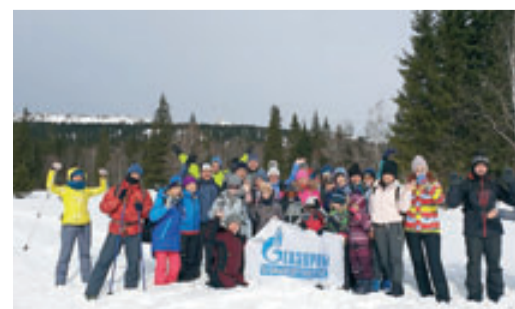
ВМЕСТЕ К ВЕРШИНАМ стр. 6