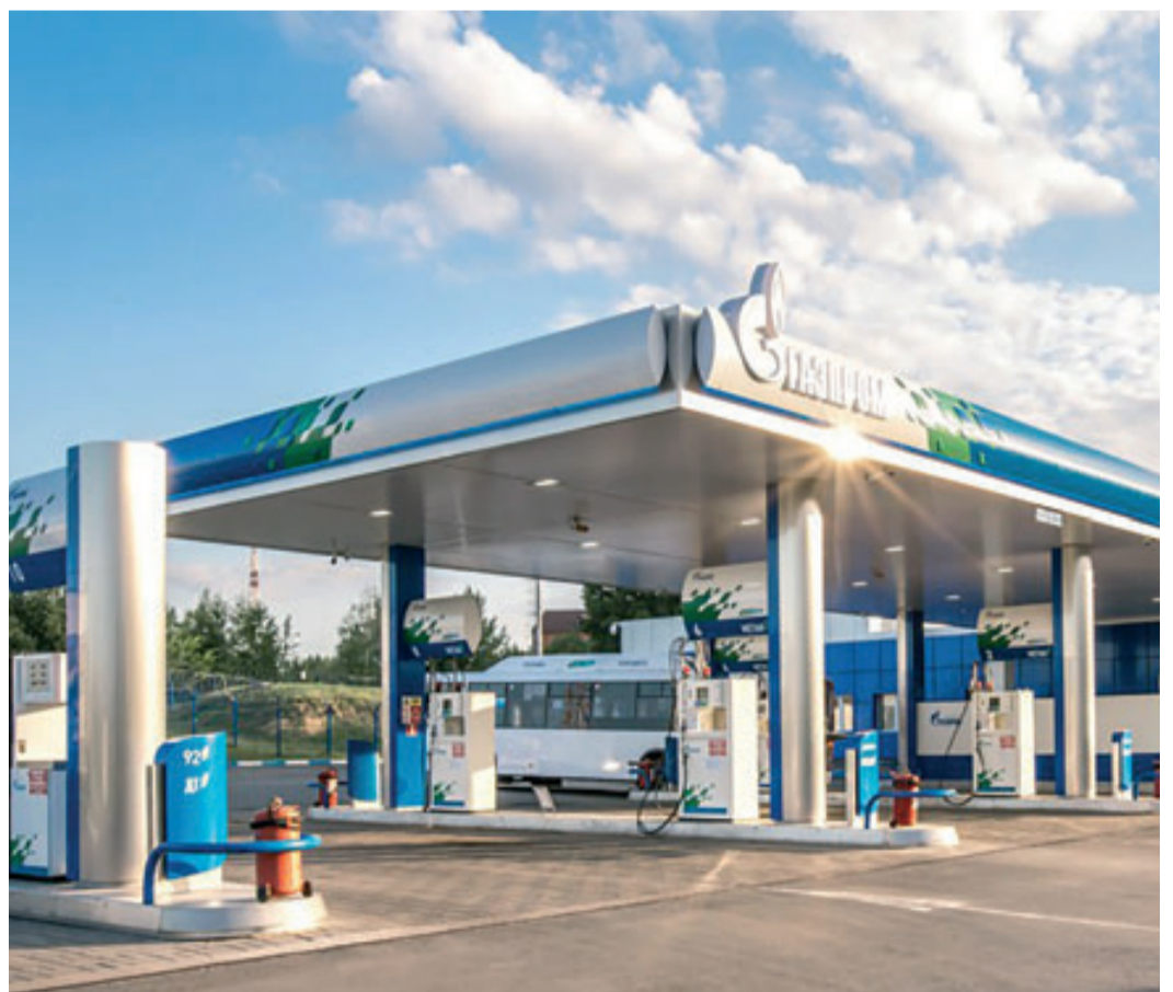
АГНКС-1 г. Уфа

ле призываю бизнес активнее участвовать в проектах по развитию рынка газомоторного топлива, инвестировать в сети заправок и топливных систем, использующих, в частности, сжиженный природный газ, – сказал Глава государства.