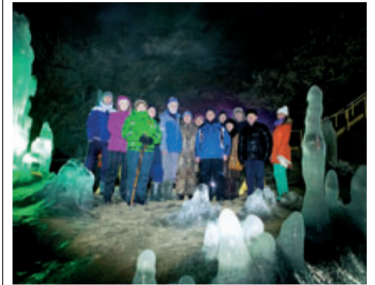
Аскынская ледяная пещера является памятником природы всероссийского значения

В Архангельском районе Башкирии состоялось торжественное открытие Аскынской ледяной пещеры. Природная жемчужина распахнулась перед посетителями в обновленном виде. Работы по благоустройству объекта проводились на средства ООО «Газпром трансгаз Уфа» в рамках реализации гранта Министерства семьи, труда и соцзащиты населения республики.