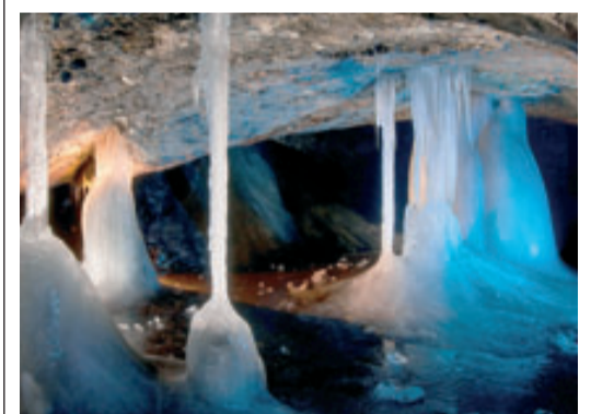
В пещере находятся сталагмиты высотой до 11 м