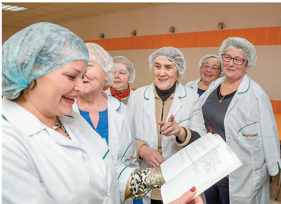
Теплая встреча активистов малого совета ветеранов ООО «Промпит» в столовой

Бывшие сотрудники комбината общественного питания проехали с экскурсией по столовым ООО «Промпит». Ветераны ознакомились с обновленными зданиями и помещениями своих бывших рабочих мест, новым оборудованием и техникой.