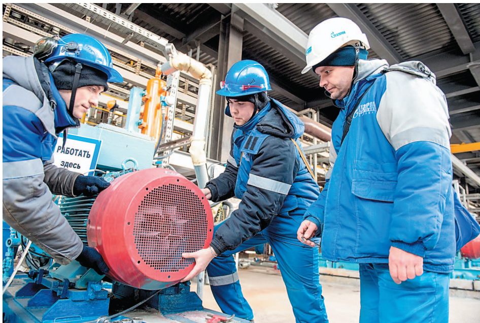
Работники цеха ТООПЭО обеспечивают надежное электроснабжение всех объектов НПЗ

оборудованием здесь постоянно возникали проблемы. Он активно принимал участие в замене морально устаревшего и физически изношенного оборудования. Участвовал в пуске ЭЛОУ АВТ-4, специально для которой подбирали современное оборудование. Установку оснастили оборудованием немецкой фирмы Siemens, считавшимся на тот момент самым передовым.