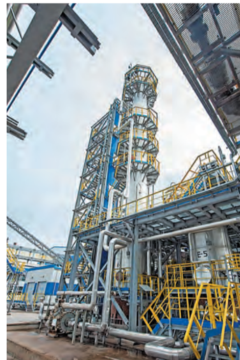
Блок флотационной очистки СЩС