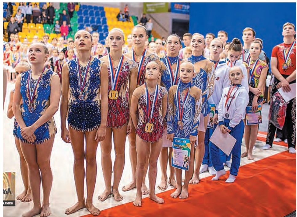
Салаватские акробатки вернулись домой с серебром и бронзой