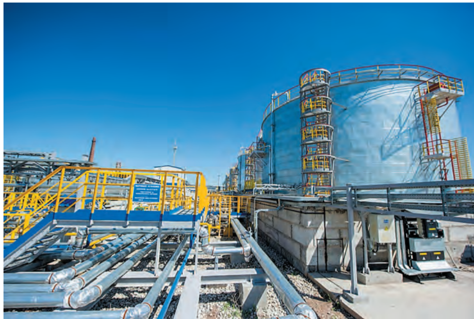
Резервуары нового блока ФОС

В цехе № 8 нефтеперерабатывающего завода завершился демонтаж резервуаров-усреднителей сернисто-щелочных стоков.