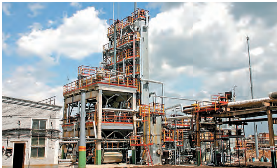
Обновление установки ОГ и КГ в 2005 году позволило увеличить выработку газового конденсата

В компании «Газпром нефтехим Салават» продолжается работа над книгой, посвященной истории развития нефтеперерабатывающего завода. Сотрудники и ветераны НПЗ с готовностью делятся своими воспоминаниями о пуске цехов и установок. В этот раз мы рассказываем об истории и развитии цеха № 8.