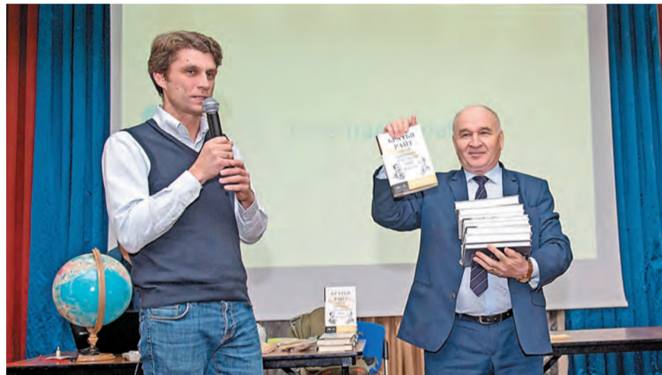
В подарок Первый лицей получил книги