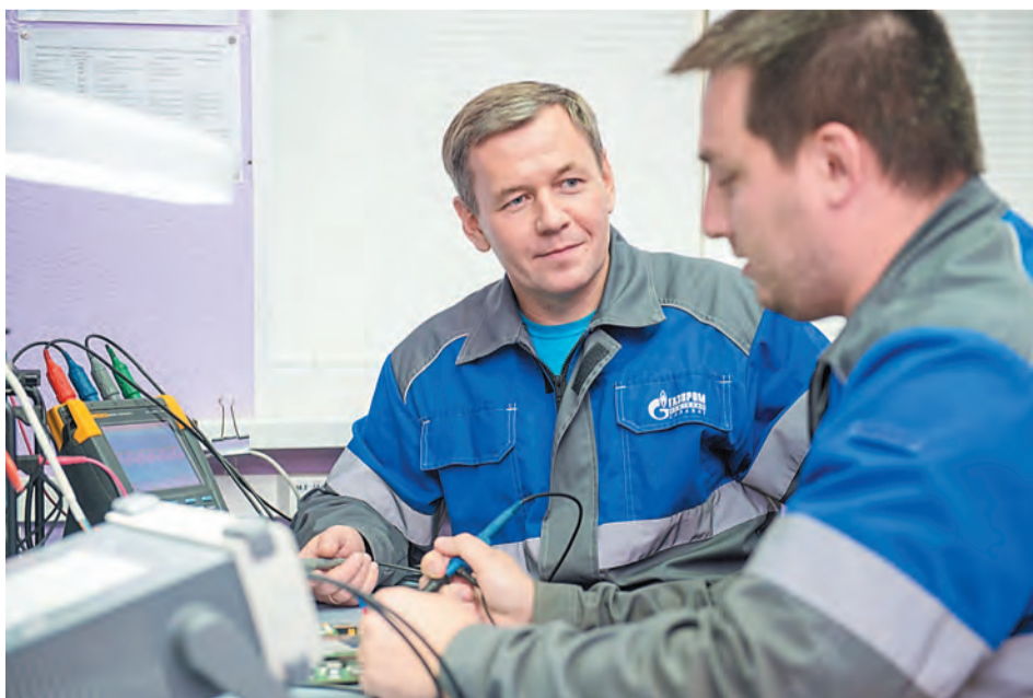
Электротехнический процесс – самый увлекательный

– Упорство, целеустремленность. Отчасти это качество сформировалось моими увлечениями, а отчасти – воспитанием. У родителей нас было трое, я – старший. Разница со средним братом была в 3 года, а вот с младшей сестрой – в 9 лет, и, когда она родилась, я по-настоящему и стал старшим. Мне была доверена миссия покупки молока. Надо понимать, что времена были советские, и днем молоко в магазине не продавалось, а для того чтобы его купить, нужно было спозаранку отстоять очередь к привозному ларьку. Так вот, было мне