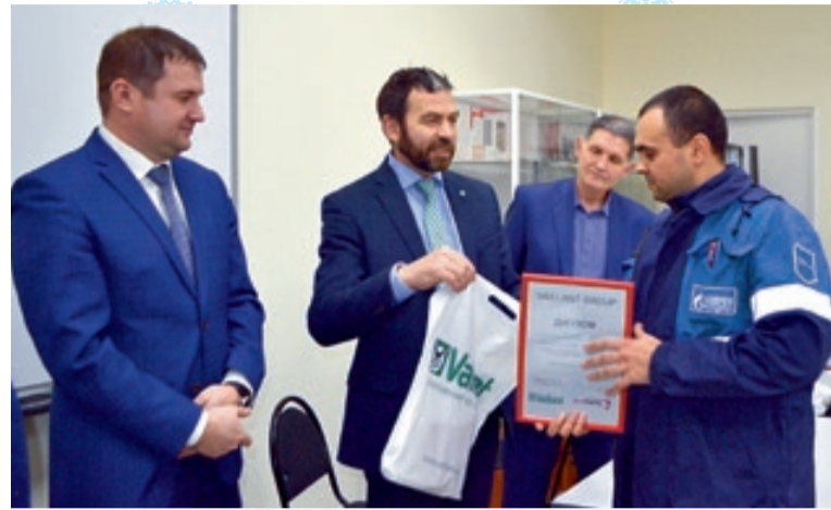
Победителям были вручены дипломы.

Главная идея подобных конкурсов — объединить людей, создать стимул для дальнейшей эффективной работы, обменяться опытом и знаниями, которыми обладает каждый участник соревнований.