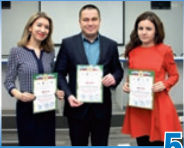
СОХРАНИМ ДЛЯ ПОТОМКОВ