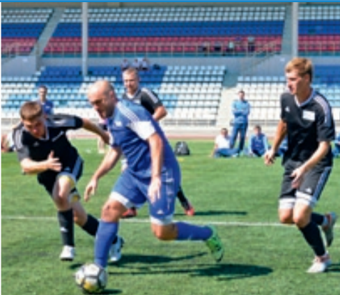
Самыми острыми, динамичными оказались футбольные баталии.