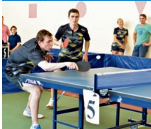
Настольный теннис остается своеобразным клубом избранных.