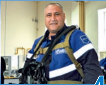
БЫСТРО ВЫЯВИТЬ И УСТРАНИТЬ