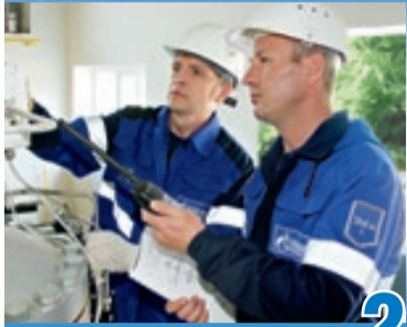
ДЕЛО МАСТЕРА БОИТСЯ