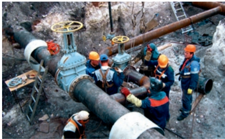
Монтаж дополнительного запорного устройства в микрорайоне Лесной.