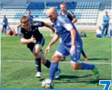
АЗАРТ СОСТЯЗАНИЙ, СИЛА ДРУЖБЫ