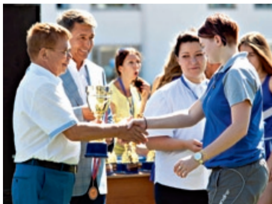
Награду газовики заслужили благодаря постоянным тренировкам, высокой стойкости духа.

заполнили фанаты этого увлекательного вида спорта. И игра действительно получилась красивой, изящной и не менее ожесточенной, а болельщики одобрительными криками и овациями поддерживали своих любимцев. В мужском волейболе в финале встретились два достойных соперника, в упорной борьбе одолевшие многих предшественников – команды Москвы (ООО «Газпром межрегионгаз Москва») и Ставрополя (ООО «Газпром межрегионгаз Ставрополь», АО «Газпром газораспределение Ставрополь»). Москвичи с первых минут продемонстрировали слаженность действий и хороший командный настрой. Взаимодействия игроков в случаях блокирования, страховки, подач и ударов со стороны нападающих соперника были выше всех похвал. В итоге именно им и досталось первое место на пьедестале почета. А спортсмены из Ставрополя, выигравшие «серебро», и вовсе свестились от счастья – ведь у них уже была «бронза» футбола. Третье место завоевала дружная команда из Нижнего Новгорода. В женском волейболе вновь лидером стала команда Москвы, в мастерстве гостям из столицы ничуть не уступали и девушки из Краснодара – именно им и досталось «серебро». Прекрасную игру показала и женская сборная Саратова (ООО «Газпром межрегионгаз Саратов», АО «Газпром газораспределение Саратов» и АО «Саратовгаз»).