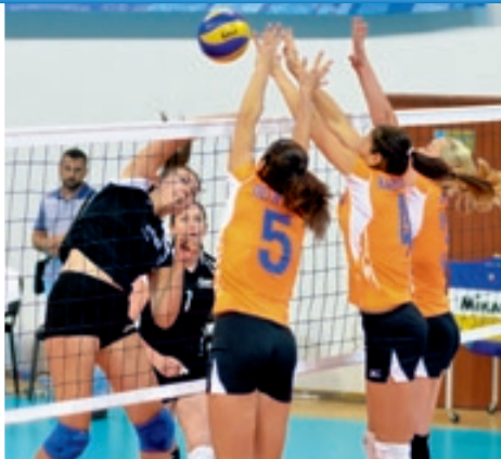
Игра в волейбол получилась красивой, изящной и ожесточенной.