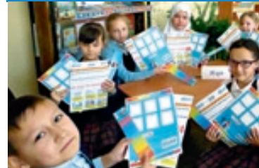
Ребята с азартом справлялись с непростыми вопросами.