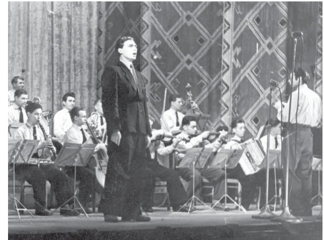
Знаменитый эстрадный оркестр комбината был создан при лекционном зале и с успехом выступал на разных сценах. Данный снимок сделан в оперном театре Уфы в 1958 году. После строительства Дворца оркестр надолго обосновался уже в нем

оказалось, что не хватает трубок для крепления на ступенях. Всю ночь перед открытием на РМЗ был аврал. Токари и слесари резали и точили 12-миллиметровые трубки для крепления. 7 ноября Дворец был открыт, внутреннее убранство выглядело царственно!