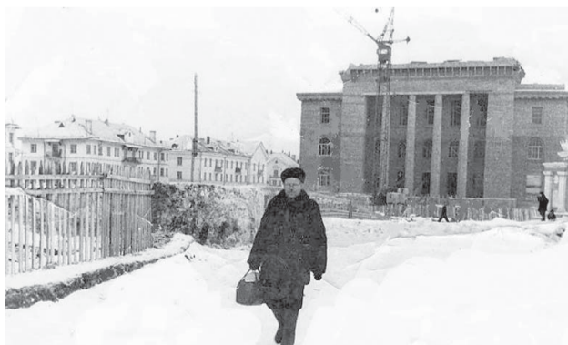
Строительство важного культурного объекта в конце 1950-х годов

оказалось, что не хватает трубок для крепления на ступенях. Всю ночь перед открытием на РМЗ был аврал. Токари и слесари резали и точили 12-миллиметровые трубки для крепления. 7 ноября Дворец был открыт, внутреннее убранство выглядело царственно!