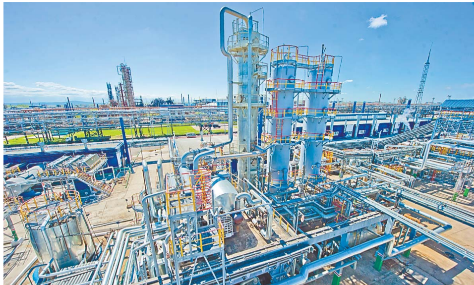
Реконструкция на установке ГО-2 направлена на доведение мощностей по дизельному топливу до проектных показателей

В рамках реализации III этапа реконструкции установки гидроочистки дизельного топлива Л-24-6 (ГО-2) в цехе № 9 завершаются строительные и отделочные работы компрессорной и помещения частотно-регулируемых преобразователей (ЧРП). В этих зданиях размещены сепараторы, холодильники и центробежные компрессорные установки. Ввод нового оборудования позволит производителям довести мощность по переработке дизельного топлива до 260 тонн в час и увеличить объем выпускаемой продукции класса Евро-5.