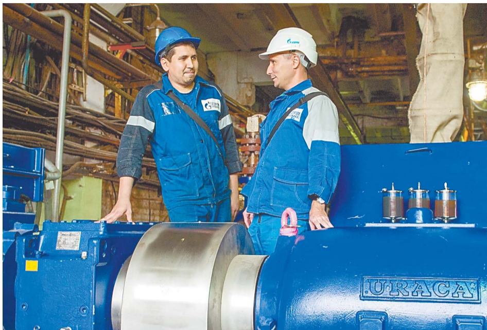
Навыки хорошего руководителя в первую очередь приходят с опытом

В этом году параллельно проходит обучение 3 группы производственников из числа кадрового резерва. Программа курса