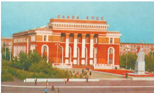
Как в 80-е годы, так и сегодня, Дворец является украшением города

Цели и задачи корпоративного Дворца культуры – формирование чувства сопричастности персонала компании миссии и стратегии предприятия. Наша аудитория – работники Общества, их семьи и дети. Мы развиваем все формы поддержки творческой активности прежде всего нефтехимиков. При этом остаемся в центре культурной и творческой жизни всего города.