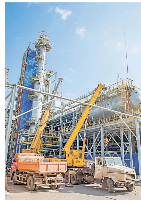
Процесс замены теплообменного оборудования на блоке стабилизации установки ЭЛОУ АВТ-6

единиц оборудования и арматуры отревизировано в капитальный ремонт второй волны на НПЗ