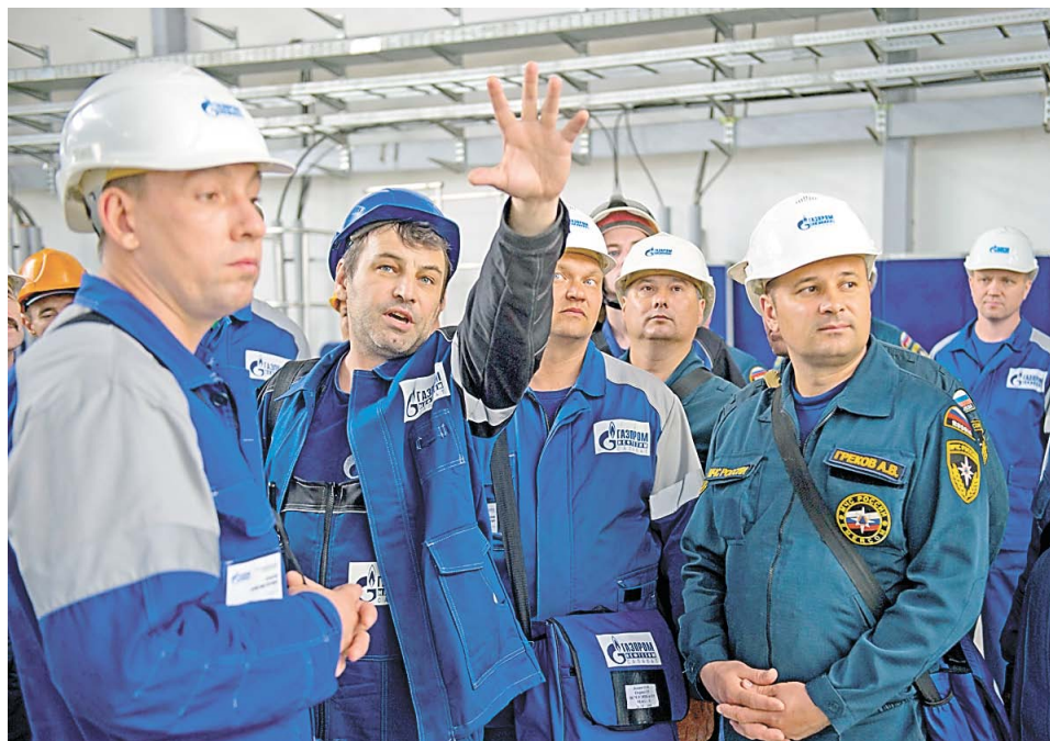
Технологический персонал рассказывает о принципах работы на установке изомеризации пентан-гексановой фракции

На установке есть здание «Операторная с ТП», здание «Закрытая насосная. Водородная компрессорная», постамент № 1 (открытая насосная), постамент № 2 (открытая насосная), блок колонн, реакторно-адсорбционный блок, реакторно-печной блок гидроочистки. В ходе изучения объекта пожарные определяли наиболее вероятные причины возникновения инцидентов и аварийных ситуаций, направление их развития, тактические способы их ликвидации.