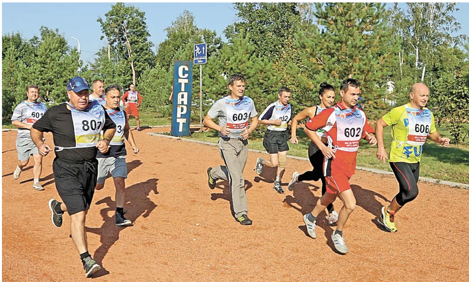
Участников «Газпромовской мили» с каждым годом становится все больше и больше

В минувшую субботу в салаватском парке культуры и отдыха прошел легкоатлетический забег «Газпромовская миля», посвященный Дню работников нефтяной и газовой промышленности. На старт вышли сотрудники ООО «Газпром нефтехим Салават».