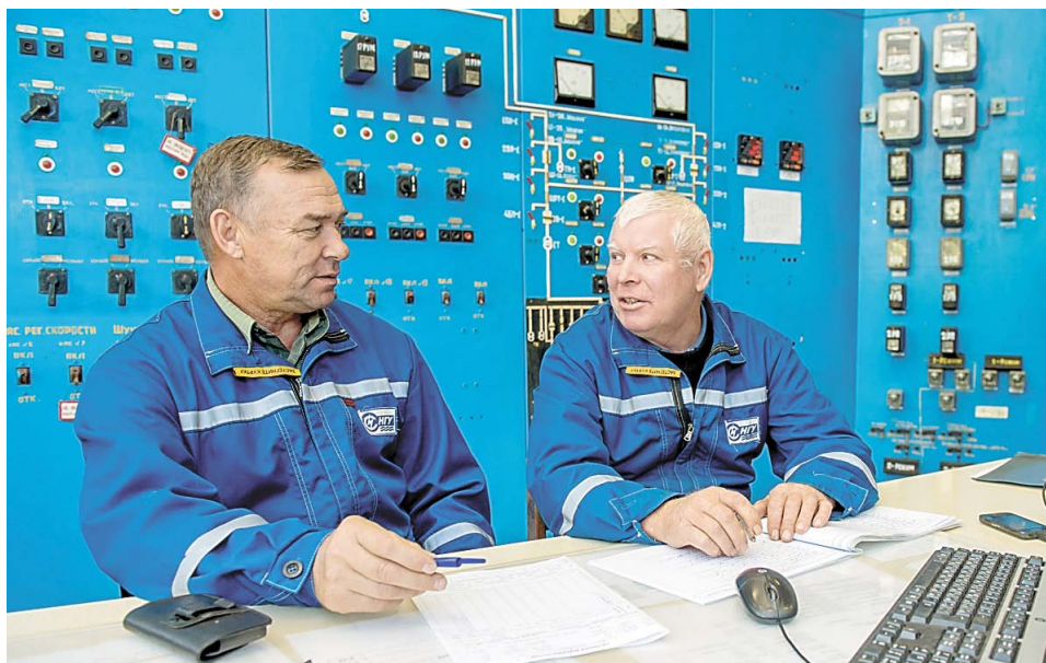
В центральном пункте управления гидроэлектростанции

На сегодняшний день Нугушский гидротехнический узел по-прежнему является одним из важных объектов Башкортостана, необходимость которого не требует доказательств. Благодаря ветеранов, стоявших у истоков эксплуатации, за их нелегкий самоотверженный труд, передачу опыта и знаний нынешнему коллективу гидроузла. Желаю работникам предприятия оставаться такими же сплоченными, сохранять и преумножать сложившиеся традиции. Здоровья всем и благополучия!