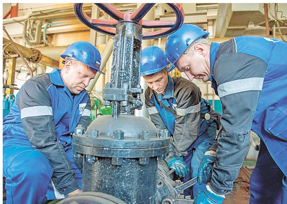
Снятие заглушки для сборки схемы сырьевого насоса на установке ГО-2

Большое количество работ осуществляется работниками цехов ремонта КИП и автоматизации НПЗ и отдела АСУТП НПЗ Управления главного метролога. Так, предусмотрена аттестация более 3500 единиц средств измерений и информационных измерительных каналов АСУТП. Будет выполнен капитальный ремонт 7366 единиц оборудования АСУТП, а также капитальный ремонт и испытания 2887 единиц средств автоматизации. На установках ЭЛОУ АВТ-6 и висбрекинга запланировано внедрение пяти двухсоленоидных систем управления отсекателями.