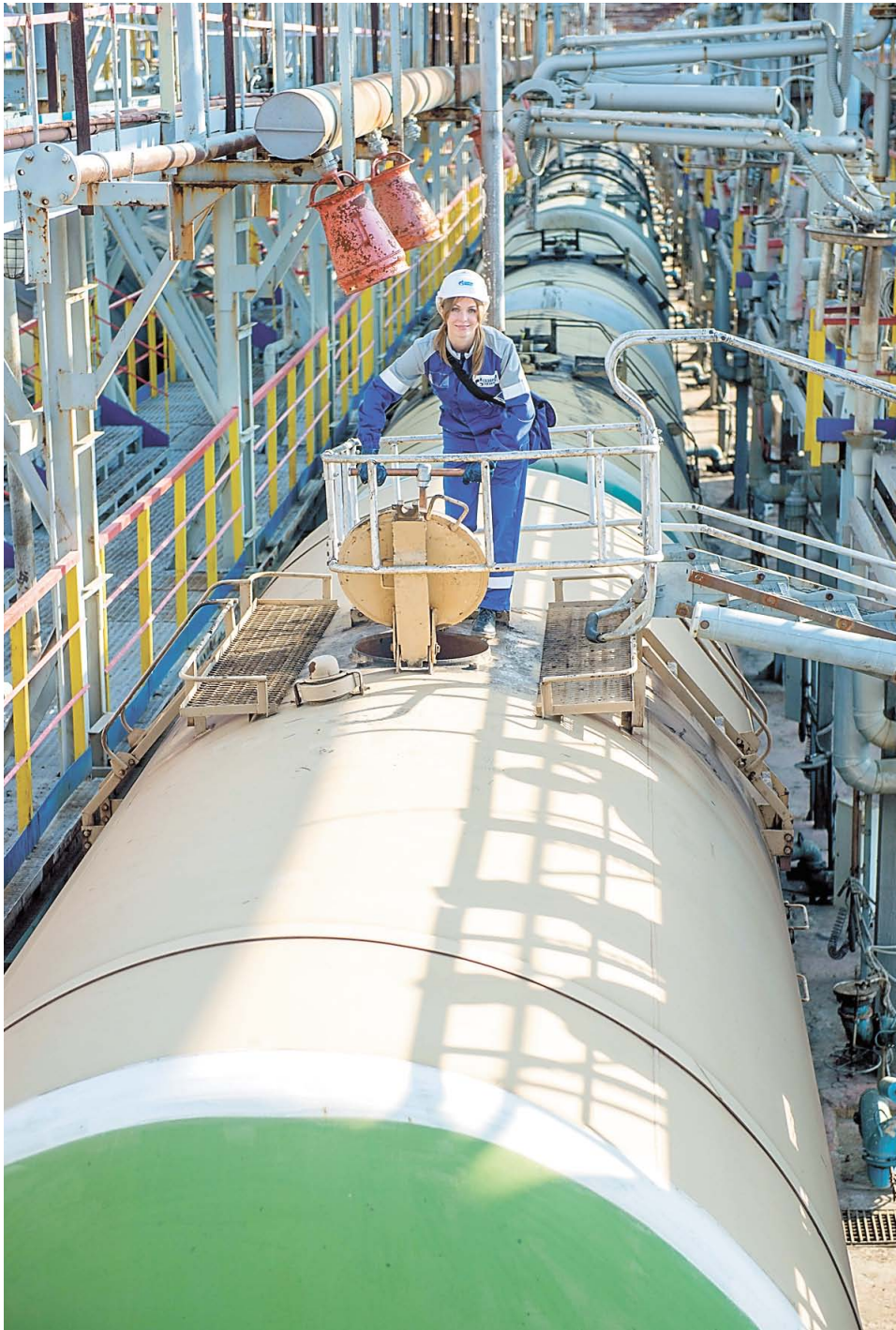
Чтобы открыть верхний клапан вагона, нужно приложить усилия