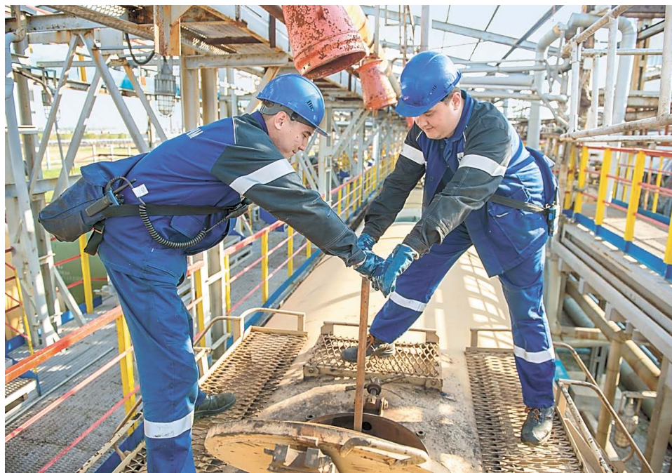
Рабочим вручную приходится обслуживать десятки цистерн в день