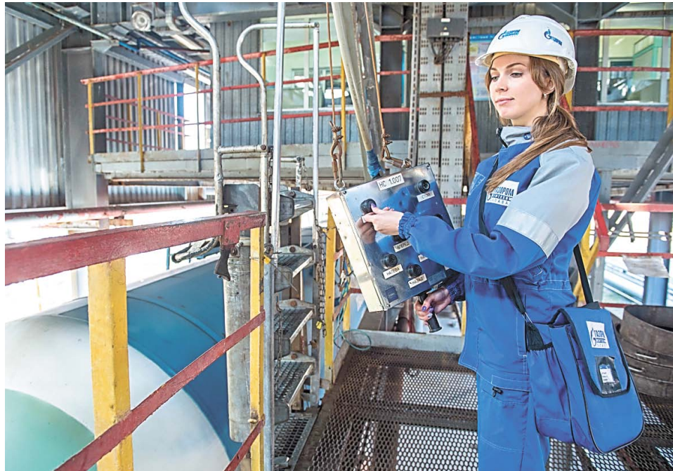
В зоне налива располагается еще один пульт управления